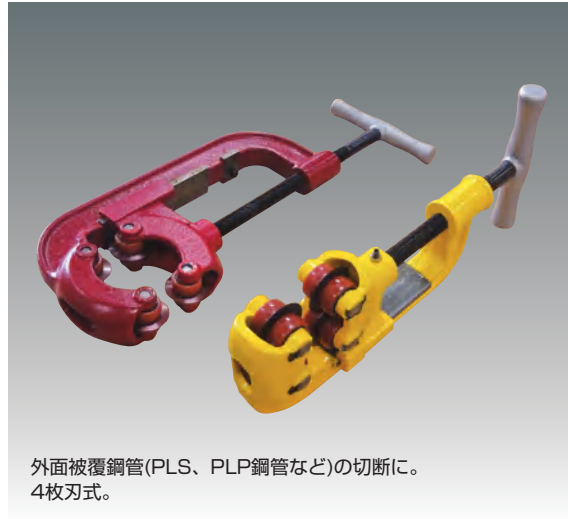
外面被覆鋼管(PLS、PLP鋼管など)の切断に。4枚刃式。