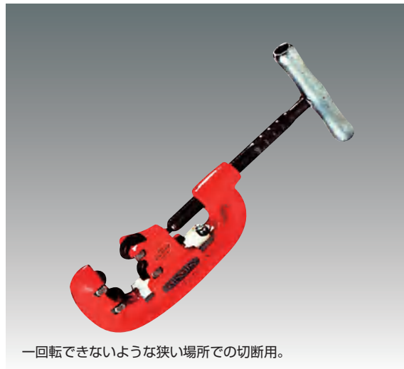
一回転できないような狭い場所での切断用。