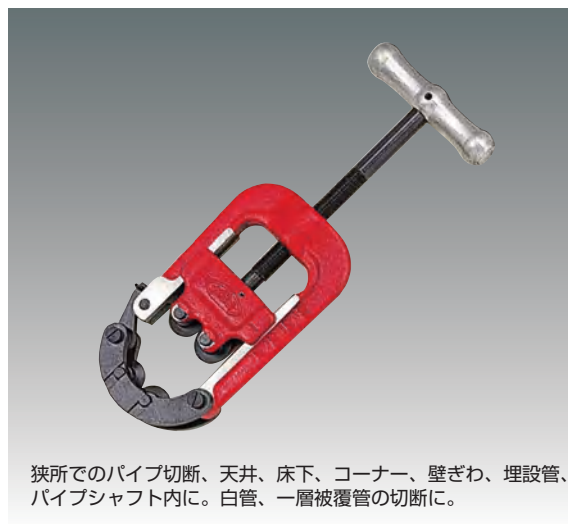
狭所でのパイプ切断、天井、床下、コーナー、壁ぎわ、埋設管、パイプシャフト内に。白管、一層被覆管の切断に。