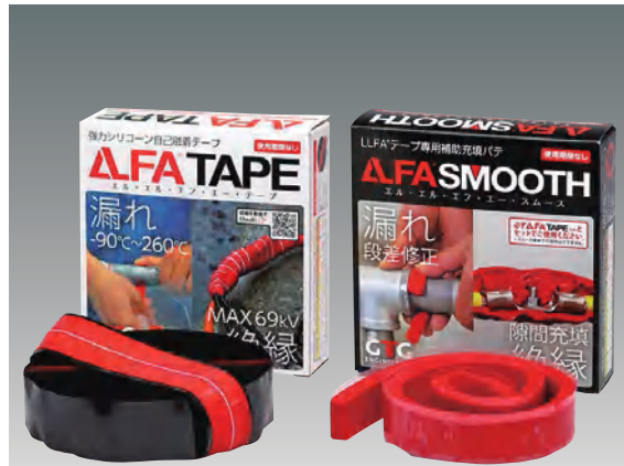
自己融着シリコンゴムテープとスムーズ (パテ)