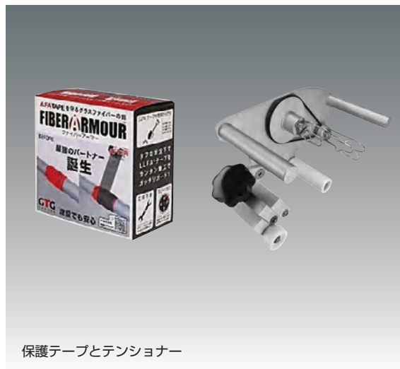
保護テープとテンショナー